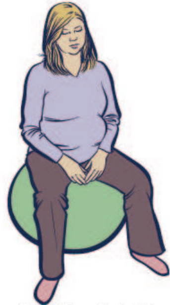
Quả Bóng Sinh Nở