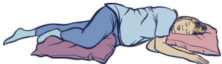
ਇਕ ਪਾਸੇ ਲੰਮੇ ਪੈਣਾ

ਇਹ ਚਿੱਤਰ ਬੇਬੀ'ਜ਼ ਬੈੱਸਟ ਚਾਂਸ: ਗਰਭ ਅਤੇ ਬੱਚੇ ਦੀ ਸੰਭਾਲ ਲਈ ਮਾਪਿਆਂ ਦੀ ਗਾਈਡ ਤੋਂ ਆਗਿਆ ਲੈ ਕੇ ਦੁਬਾਰਾ ਛਾਪੇ ਗਏ ਹਨ। ਲੇਬਰ ਅਤੇ ਡਲਿਵਰੀ ਬਾਰੇ ਜ਼ਿਆਦਾ ਜਾਣਕਾਰੀ ਲੈਣ ਲਈ www.bestchance.gov.bc.ca ਵੈੱਬਸਾਈਟ ਦੇਖੋ।