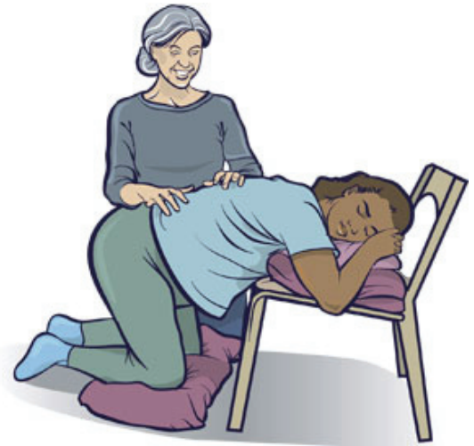
ਗੋਡਿਆਂ ਭਾਰ ਹੋਣਾ